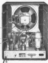
VE 301 Dyn W